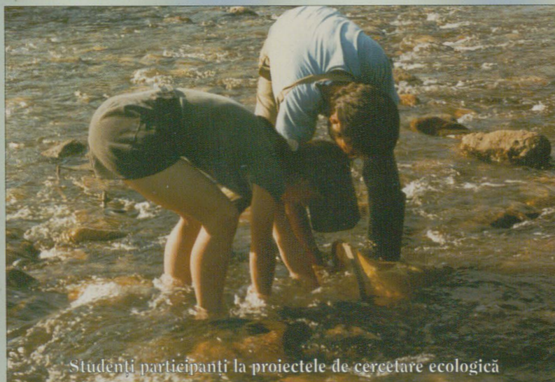
Studenti participanti la proiectele de cercetare ecologică

Rezultatele studiilor au fost prezentate cu ocazia conferințelor publice din Tîrgu-Mureș (1995, râul Mureș), Satu Mare (1996, râul Someș), Sovata (1997, bazinul Crișului), la care au fost invitați reprezentanții ministerelor de resort și parlamentari din comisiile de protecție a mediului din România și Ungaria, consilieri locali din localități riverane, autorități cu activități în domeniul ecologiei. În anul 2002 s-a organizat Forumul ecologic internațional „Rîurile să curgă libere și curate”.